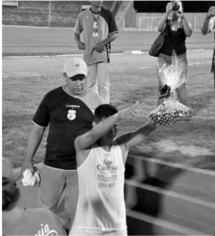
Atacante ganha prêmio após o jogo e agradece a torcida pelo carinho