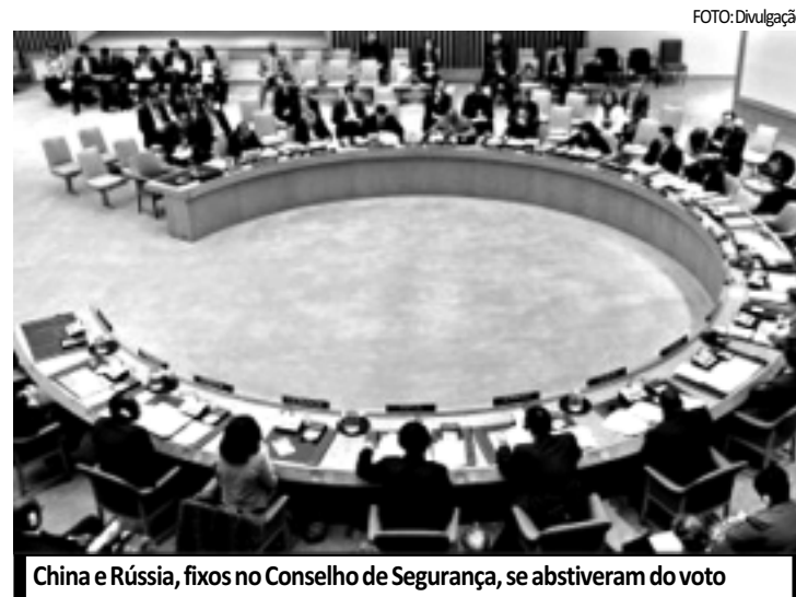
China e Rússia, fixos no Conselho de Segurança, se abstiveram do voto

Bretanha e a França defendem uma intervenção na Líbia, mas a Rússia e a China, os outros países com poder de veto no conselho, se opõem ao uso de força contra um país soberano.