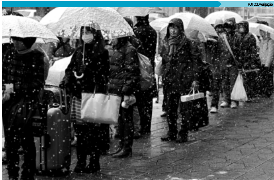
Debaixo de neve, japoneses aguardam a vez de pegar ônibus para deixar Sendai, cidade que foi devastada pelo tsunami

Desde a sexta-feira passada, o Consulado Geral do Brasil em Tóquio e a embaixada brasileira trabalham em regime de emergência, 24 horas. Quem não conseguiu contato com pessoas que moram nas regiões atingidas pode ligar para 00-XX-81-3-5488-5665 ou 00-XX-81-50-6860-6242. O e-mail do setor de assistência a brasileiros é assistencia@consbrasil.org.