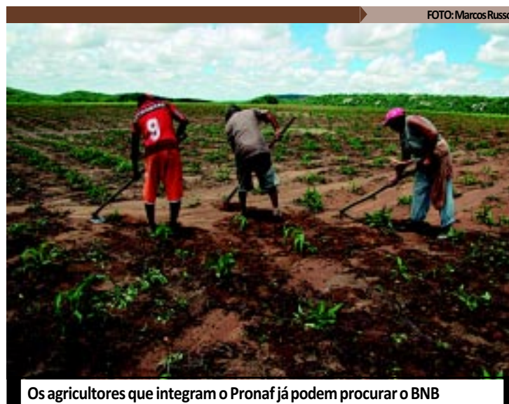
Os agricultores que integram o Pronaf já podem procurar o BNB

No caso de crédito coletivo - concedido a cooperativas e associações -, o saldo devendo atualizado é dividido pela