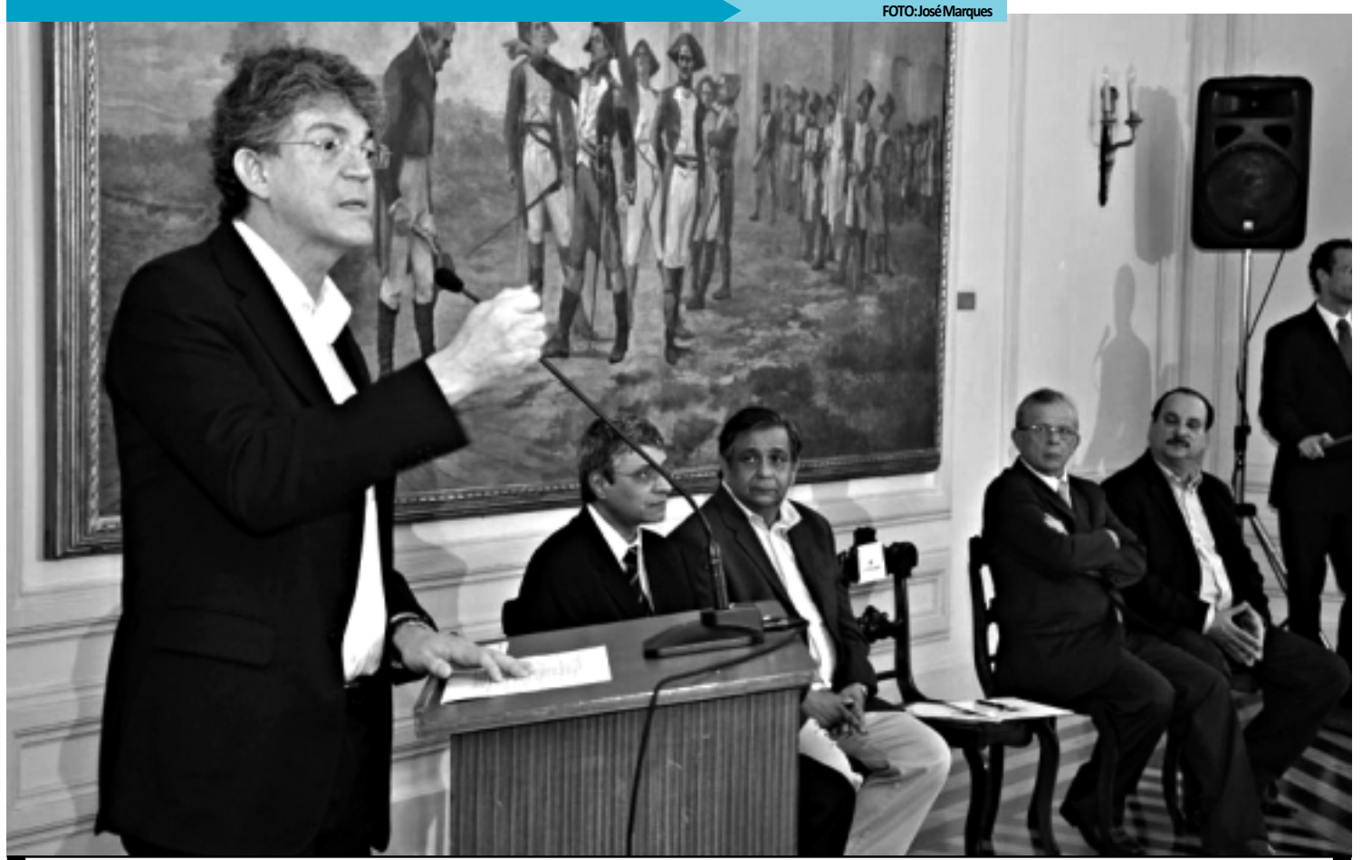
Ricardo Coutinho falou sobre a abertura de parcerias com todas as prefeituras durante assinatura dos convênios com a administração da Capital

Também foi assinado convênio para que 40 alunos do curso de Construção do Projovem Urbano possam ter suas aulas práticas nas reformas das escolas estaduais e receber uma bolsa de R$ 100 por mês do Estado e transporte por parte da Prefeitura. Outro convênio garante a realização do Projeto 'Som das Seis', mantido pela Prefeitura, que passará