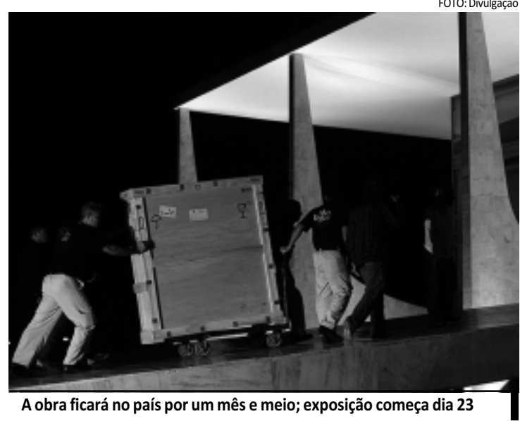
A obra ficará no país por um mês e meio; exposição começa dia 23

Esse avanço é resultado do bom desempenho da economia, com crescimento de 7,5% do Produto Interno Bruto (PIB) - o total de riquezas produzidas no país - em 2010. Além disso, ele atribuiu a melhoria salarial às ações das entidades sindicais na luta para a valorização do mínimo. "A estabilização da inflação, o mercado de trabalho em alta, o crescimento da oferta de crédito e a melhoria da renda estimularam a economia", apontou.