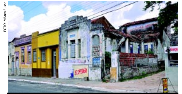
[FOTO&LEGENDA] No Centro da Capital, casarões antigos abandonados dividem espaço, lado a lado, com imóveis também antigos - muitos tombados - devidamente preservados. Os locais abandonados ficam à mercê de bandidos e animais peçonhentos. Um risco.