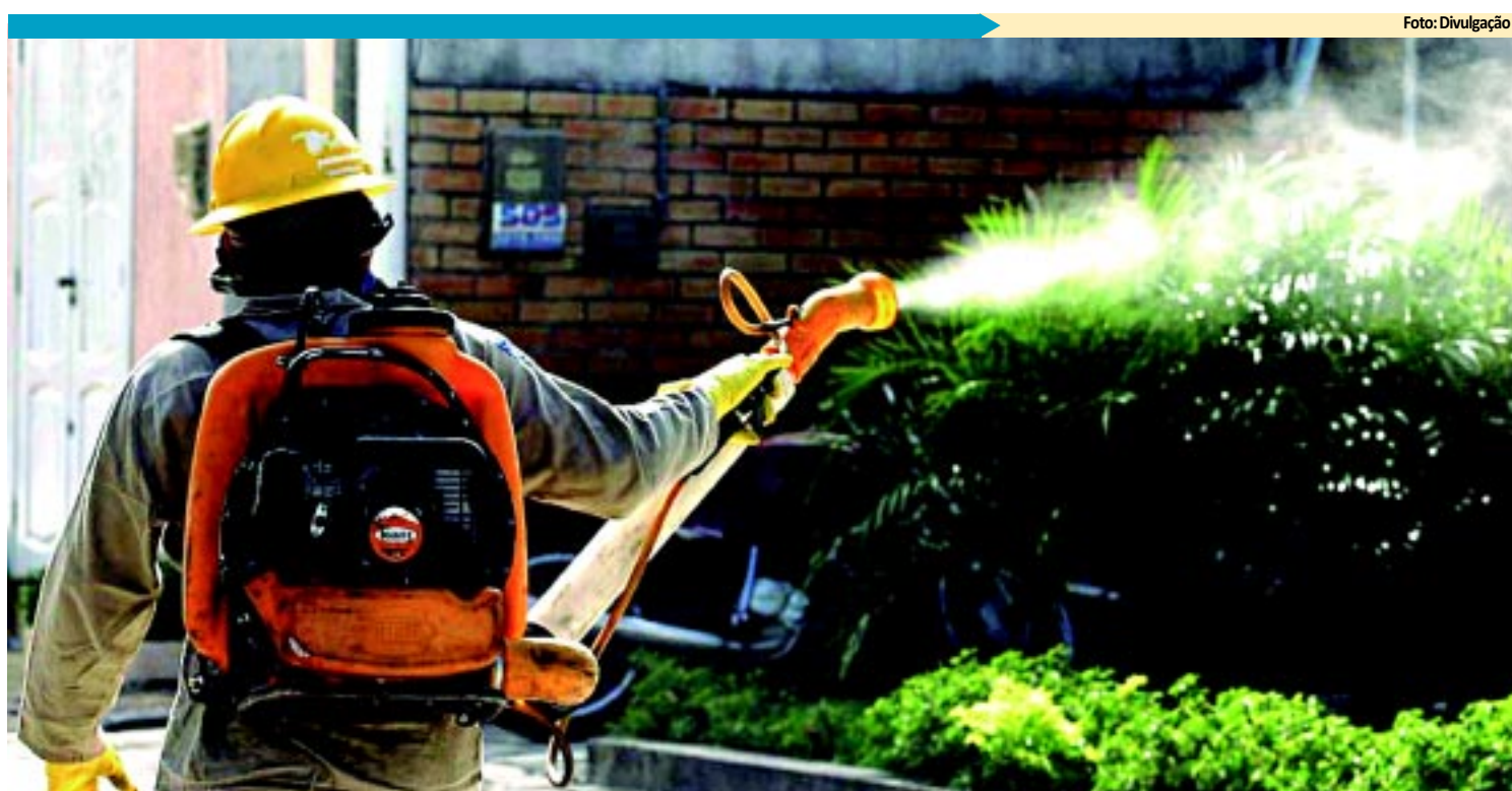
CAPITAL Combate ao mosquito da dengue terá Dia 'D' Distrital e fumacê nos bairros PÁGINA 8

total das dívidas ou o desconto de 85% para operações contratadas até janeiro de 2001 com o valor de até R$ 35 mil. Até agora, já foram perdoadas as dívidas de 8.168 financiamentos, enquanto outros 2.042 foram liquidados com desconto. PÁGINA 12