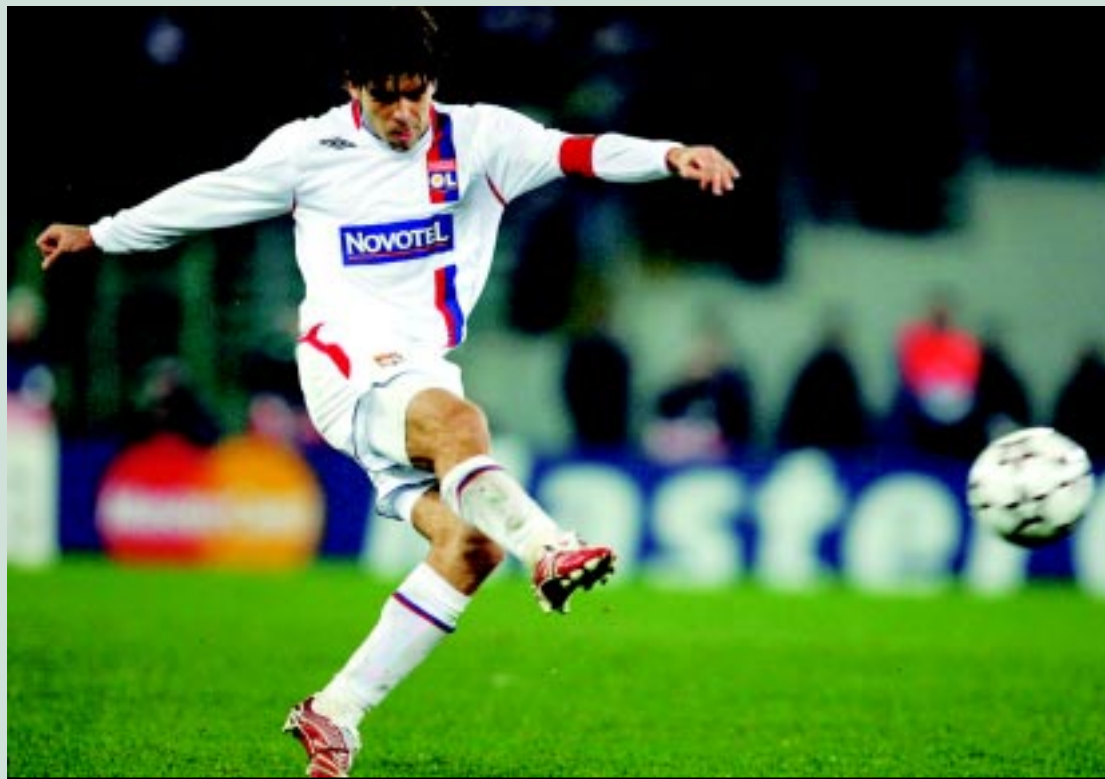
Juninho Pernambucano deverá voltar a São Januário no mês de junho, para encerrar a carreira de jogador

No entanto, a ansiedade pelo retorno do ídolo, que está com 36 anos, deve parar em São Januário até junho. Juninho Pernambucano, apesar de deixar claro aos árabes do Al Gharafa que não vai renovar seu contrato - muito em função da demissão do técnico brasileiro Caio Júnior - não pretende deixar o time antes