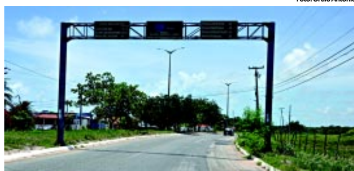
A obra será iniciada no segundo semestre deste ano

O DER vai construir uma rodovia ligada a PB-008, Litoral Sul do Estado, com a extensão de 4,5 km, para evitar o congestionamento de veículos no distrito de Jacumã, no Conde. A construção terá seu início no segundo semestre deste ano. O custo da obra está orçado em R$ 2,8 milhões e vai gerar emprego e renda para cerca de 70 trabalhadores. PÁGINA 9