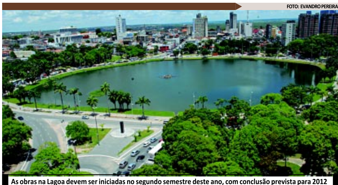
As obras na Lagoa devem ser iniciadas no segundo semestre deste ano, com conclusão prevista para 2012