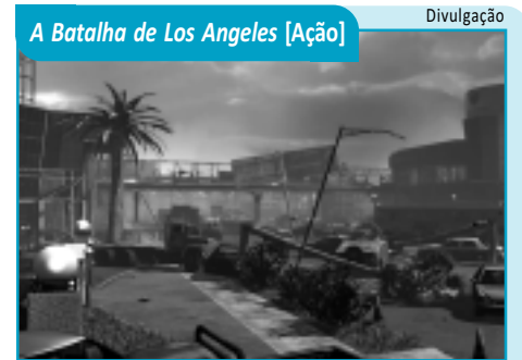
A Batalha de Los Angeles [Ação]

O DISCURSO DO REI (The King's Speech, Inglaterra, 2010). Gênero: Drama. Leg. Duração: 118 min. Classificação: 12 anos. Direção: Tom Hooper, com Colin Firth, Helena Bonham Carter, Derek Jacobi, Andrew Havill. Após ver o irmão abdicar o trono inglês, George assume a coroa. Gago, busca ajuda para comandar o país na II Guerra. CinEspaço 1: 18h30 e 21h.