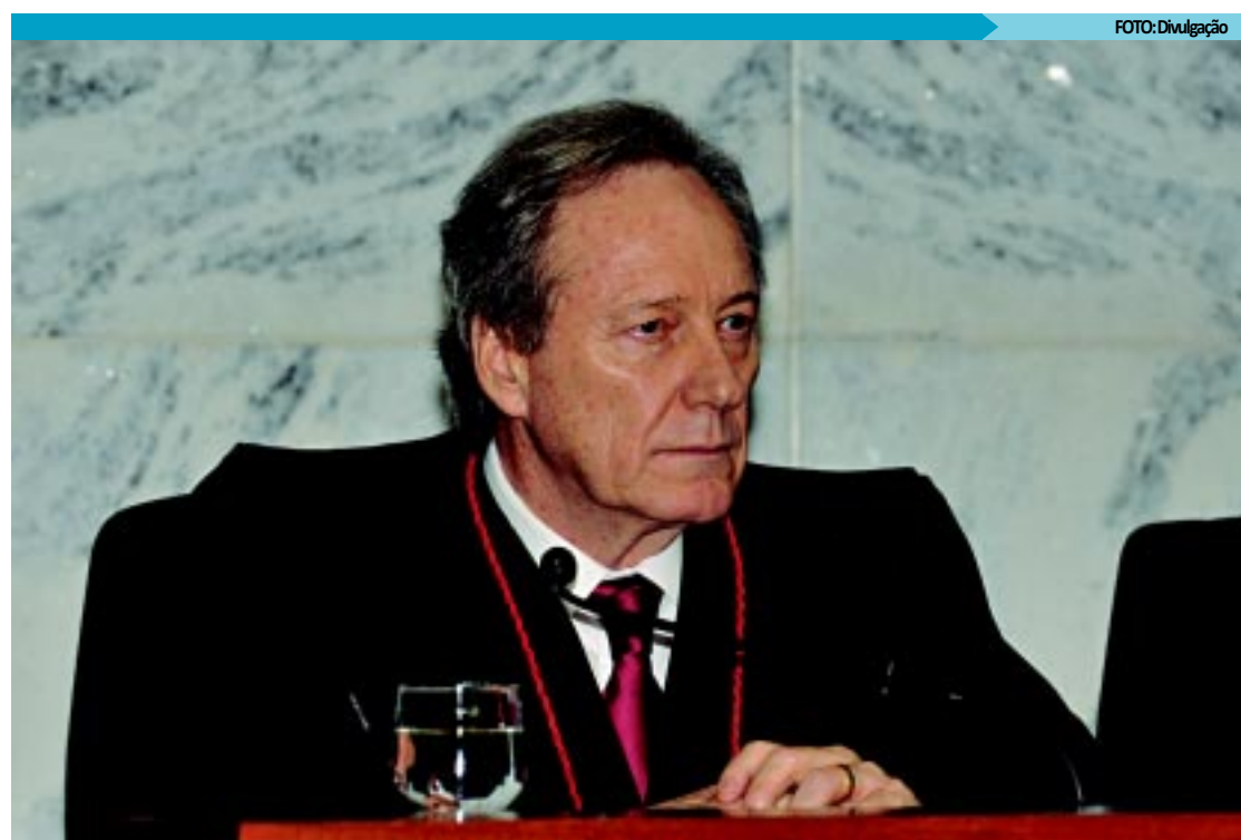
Ricardo Lewandowski, também é presidente do Tribunal Superior Eleitoral (TSE)

"Nos casos de investidura em cargos do Executivo, o parlamentar faz uma opção política sem nenhum prejuízo para a legenda que consentiu e é beneficiária do cargo", argumentou Lewandowski.