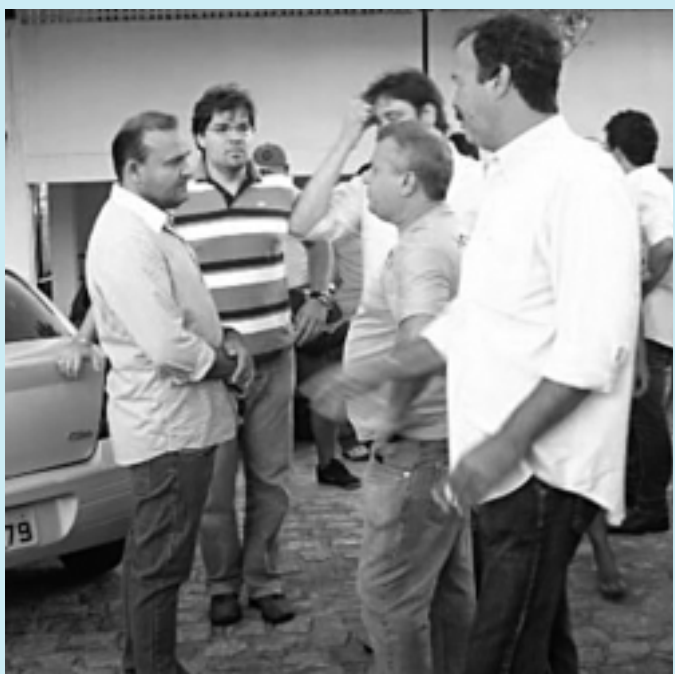
Dirigentes do Campinense tratando da contratação de reforços