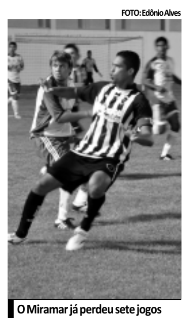
O Miramar já perdeu sete jogos

Depois de perder para o Treze por 4 a 0 e se manter na lanterna do Estadual com apenas um ponto, o Miramar renuncia hoje as atividades para o jogo de amanhã, contra a Desportiva Guarabira, no estádio da Graça, e que pode tirar o time cabedelense da última posição. O coletivo pronto será realizado no estádio Francisco Figueiredo de Lima, em Cabedelo.