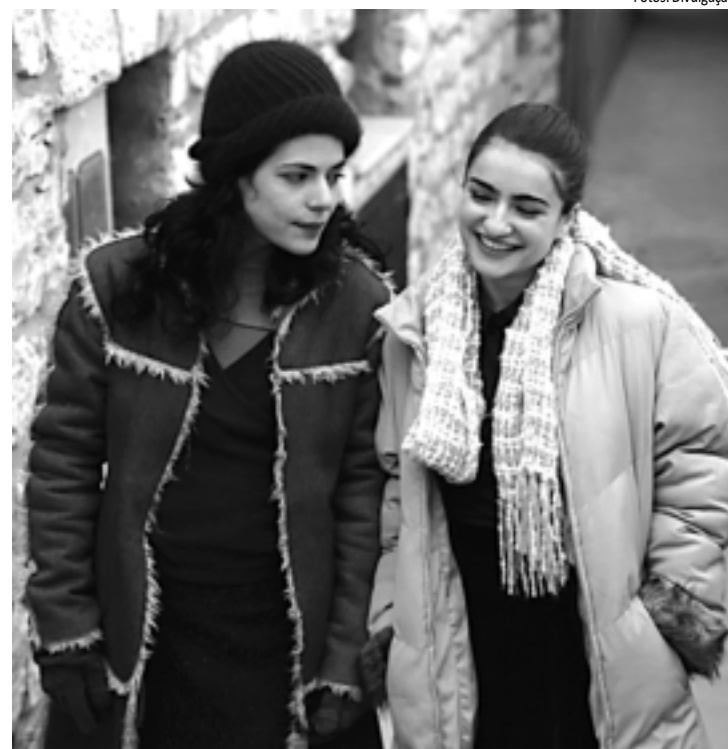
Cena de Segredos Íntimos (França/Israel, 2007), com direção de Avi Nesher

A exibição do filme Mulheres do Brasil será destinada exclusivamente a 550 servidoras municipais, estaduais e da Emur, com distribuição de senhas entre as espectadoras. O longa-metragem mistura ficção e documentário, reunindo cin-